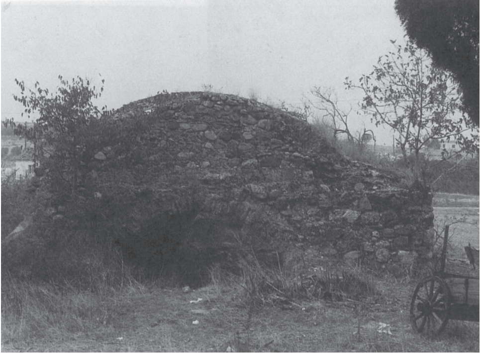
Κατάλοιπα ρωμαϊκών λουτρών στα Θερμά της Νιγρίτας

Στη σύνοδο φρόντιζαν για την οργάνωση των γιορτών, των αγώνων και των θεατρικών παραστάσεων. Συζητούσαν για την τοπική διοίκηση της κάθε πόλης, για τους δημοσίους υπαλλήλους και για το πώς συμπεριφέρονταν αυτοί στους πολίτες. Εξέφραζαν τις ευχαριστίες ή τα παράπονά τους στο γενικό Ρωμαίο διοικητή της περιφέρειας ή και στον αυτοκράτορα ακόμη. Αποφάσιζαν στο συνέδριο για κοινά θέματα των πόλεων, όπως π.χ. για την ανέγερση ανδριάντων προς τιμή του αυτοκράτορα, για την ίδρυση βωμών και αναθηματικών στηλών, για την ανέγερση μνημείων και την κατασκευή δρόμων της επαρχίας. Στο κοινό της Πενταπόλεως δεν ανήκαν η Σκοτούσσα, η Αμφίπολη και οι Φίλιπποι, διότι οι δύο πρώτες κηρύχθηκαν ελεύθερες από τους Ρωμαίους, η δε τρίτη ήταν ρωμαϊκή αποικία.